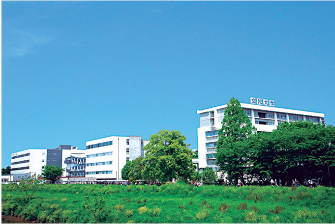
文教大学越谷キャンパス 埼玉県越谷市南荻島3337